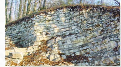
[20] Extreme Schichtneigung am Forstweg