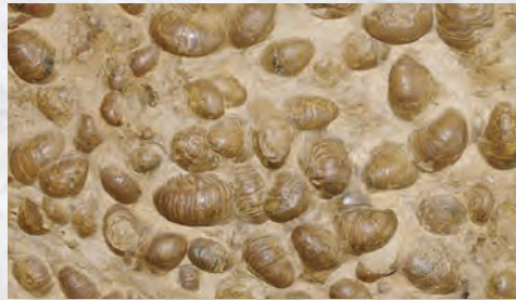
[7] Die Gekrümmte Greifenauster Gryphaea arcuata ist gesteinsbildend