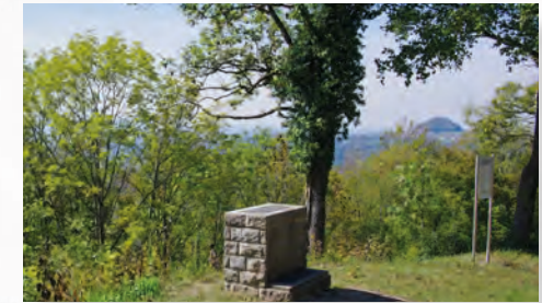
[21] Panoramablick zum Hohenstaufen