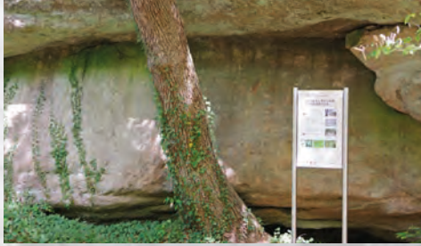
[2] Felsen aus Mittlerem Stubensandstein