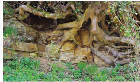
[14] Steilanstieg im Eisensandstein