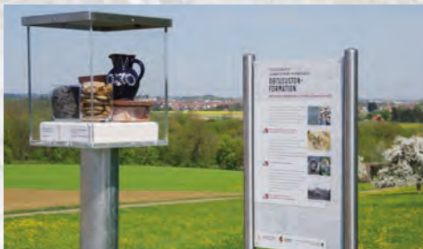
[8] Obtusustone im Unterjura