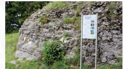
[22] Schwammriff im Oberjura