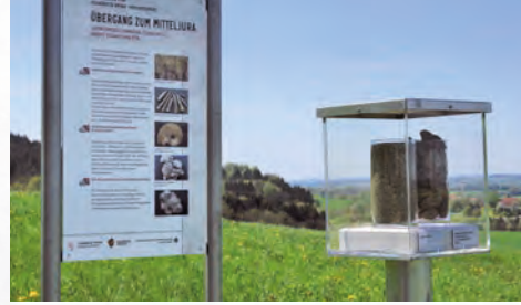
[12] Jurensismergel im Unterjura