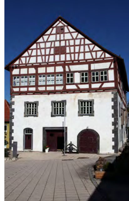
Konzeption Miedermuseum: Kerstin Hoopferstutz M.A., Stuttgart Gestaltung Flyer: marcus mantel | büro für gestaltung